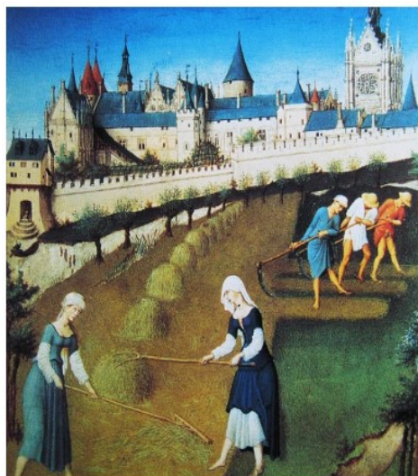
Representação de um feudo medieval. Servos trabalhando no campo, o castelo da nobreza e uma igreja católica.

Abaixo você encontrará duas imagens e um texto que tratam das mudanças na forma de viver no período conhecido como Idade Média. Você poderá perceber que a forma de trabalhar e viver muda no tempo e no espaço.